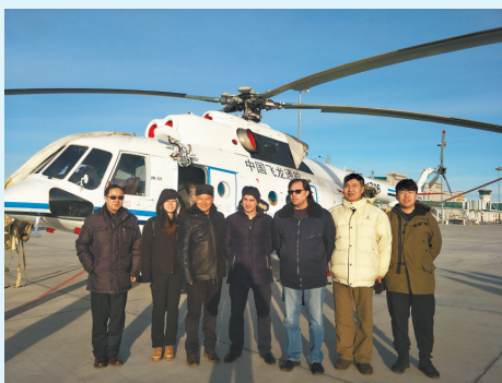
3个月的口岸到自贸区再到作业地的往返飞行时间,使得直升机能够及

此次直升机的引进首次利用了我国自由贸易区政策,这种模式免除了航空器进口环节的增值税,进口关税也可分期支付,大大减轻了通航企业的资金压力,改善了通航运营公司的资产负债状况,在我国通航领域具有深远的创新意义。同时,直升机在天津东疆港属地报关,在作业地附近的满洲里口岸实施货物验放,既节省了长途调机的大量经费,又节约了近