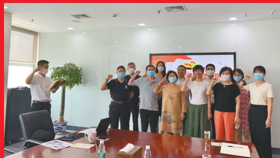
机关党委第二党支部