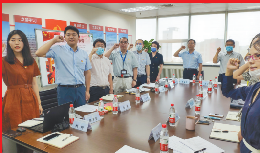
机关党委第三党支部