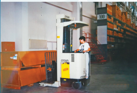
在波音库房开铲车上货

二是发货。同样，根据每批货的大小，开着升降车或铲车到货架上取货，放到包装区域，按规定进行包装。大件货还得用塑料打包带或铁皮打包带，易碎零件（如：飞机舷窗玻璃）需在外包装上标识清楚。三是定期盘库，若出现差异，需在系统中进行更正。库房工作是艰苦的，一方面，无法正常作息，下班后需经常“倒时差”，刚接近正常又该上班了，一年四季，循环往复；另一方面，要忍受冬日的寒冷和夏日的炎热与蚊虫叮咬。虽然电脑操作间内有空调，但库房里没有。冬天进库房干活儿得穿上羽绒背心，夏天在库房里收发货，经常是边跳着“踢踏舞”边干，力求动作迅速，不敢拖延，以便尽快回到工作间里，只有春秋在在库房里工作要从容些。但我们仍以优质的服务赢得了客户和波音公司的认可，令人欣慰。如今的波音库房，因首都机场扩建已随北京分公司搬迁至如今的集团公司园区内，工作人员也不断更新，但依然为国内使用波音飞机的民航客户提供着备件保障服务。