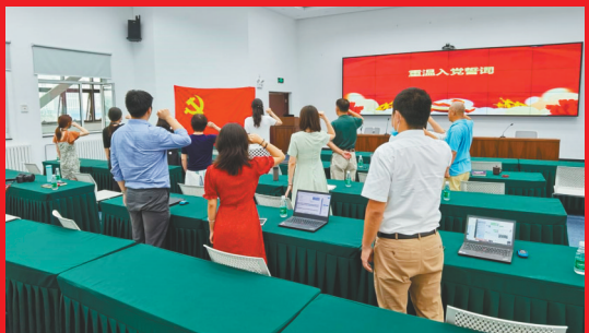
有限公司第三党支部