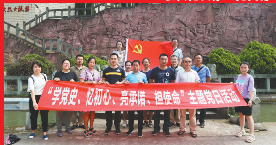
西南公司第一、第二党支部