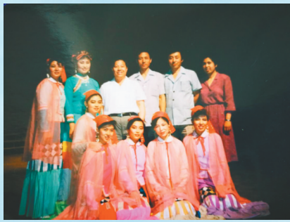
参加民航文艺汇演的演员及领导

为了保证为客户提供24小时备件供货服务，最初库房管理人员实行“上24小时，休72小时”的倒班制，8个人分4组轮班，全年不分节假日，经常赶上农历大年三十或大年初一到岗服务。因为航班不停，我们就得保证备件供应不缺位。每天，航空公司的航班起飞前，机务人员都要对飞机认真进行检测、检修，以保障飞行安全。我们经常夜间接到AOG订单（紧急订货），需要随时处理、备货，以保证客户按时提货，不耽误使用。服务中心库存系统与美国波音总部系统联网，便于随时掌握库存备件品种及数量的变动，不断补充；遇到北京备件中心机器设备出现故障的情况，立即与波音总部的中方工作人员电话沟通，及时解决。我们的日常工作，一是收货。对每批到货进行清点，有些大包装的螺钉螺母，还需拆分小包装，然后扫码上架。 ▶转5版