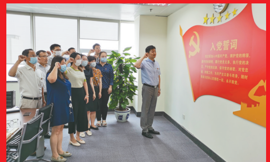
机关党委第一党支部